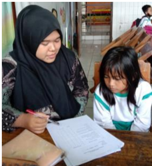
Gambar 1. Wawancara Peserta Didik

Hasil observasi tentang profiling gaya belajar peserta didik, akan dijadikan sebagai patokan guru dalam menentukan dan merancang pembelajaran yang sesuai dengan hasil profiling peserta didik di kelas IB SD Negeri gayamsari 02 Semarang. Adapun tujuan dari penelitian ini adalah (1) untuk membuat pemetaan gaya belajar peserta didik pada rancangan pembelajaran di kelas IB SDN Gayamsari 02 Semarang (2) mendesain rancangan pembelajaran yang sesuai dengan hasil observasi profiling peserta didik di kelas IB SD Negeri Gayamsari 02 Semarang.