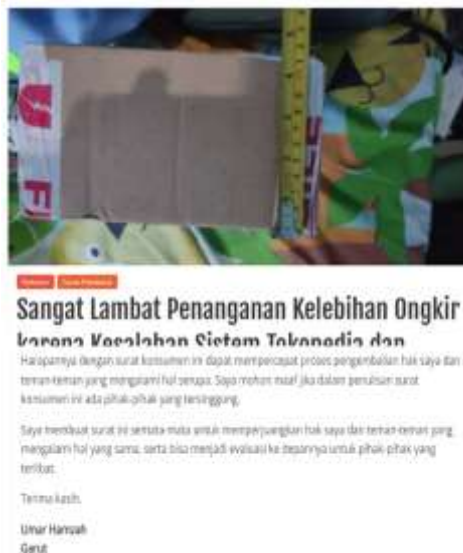
Gambar 1. Berita Keluhan Kosumen Garut E-commerce Tokopedia

Semakin banyak kerugian yang dialami oleh para pengguna e-commerce Tokopedia, dan kerugian tersebut diungkapkan secara publik karena respons yang kurang responsif dari e-commerce Tokopedia, akan menyebabkan kehilangan kepercayaan dari konsumen, karena para pengguna Tokopedia merasa ada rasa ketidakamanan sehingga memutuskan tidak jadi membeli di platform e-commerce Tokopedia. Oleh karena itu, keberadaan produk yang memiliki kualitas tinggi dan informasi menjadi sangat penting, karena informasi yang terdapat di situs web dapat memengaruhi cara pelanggan menilai kualitas layanan elektronik, termasuk pada e-commerce . (Amsl et al., 2023).