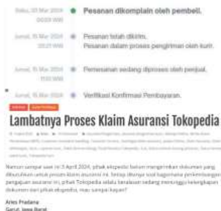
Gambar 1. Berita Keluhan Kosumen Garut E-commerce Tokopedia

Keluhan lainnya yang diberitakan oleh Media Konsumen (2024) dari konsumen Garut dalam menggunakan e-commerce Tokopedia diajukan pada tanggal 17 Oktober 2024 oleh konsumen yang bernama Umar Hamzah yang mengeluhkan lambatnya penanganan kelebihan ongkir karena kesalahan sistem Tokopedia dan Xiaomi Official Store . Umar Hamzah mengeluhkan karena kesalahan sistem aplikasi Tokopedia, dimana deskripsi produk menunjukkan berat 6 kg, yang menimbulkan kejanggalan. Admin tokopedia tidak merespons permintaan perubahan sebelum peluncuran produk. Setelah peluncuran, berat produk tiba-tiba berubah menjadi 1.5 kg, yang sesuai dengan berat paket smartphome. Umar Hamzah membeli smartphone pada tanggal 6 Oktober 2023 namun terdapat kesalahan dalam sistem ongkir di Tokopedia, hingga 16 Oktober Umar Hamzah masih belum mendapatkan kepastian dalam proses ganti rugi oleh pihak Tokopedia.